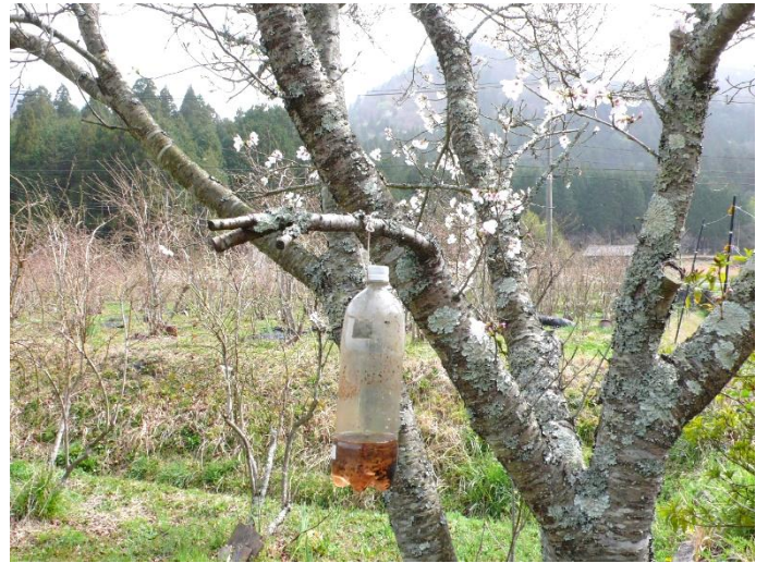
その木にスズメバチの捕獲機を取り付ける。穀物酢、ブルーベリー酢、黒糖酢、砂糖、少しの水を混ぜた液が入っている。全部で3か所にぶら下げた。