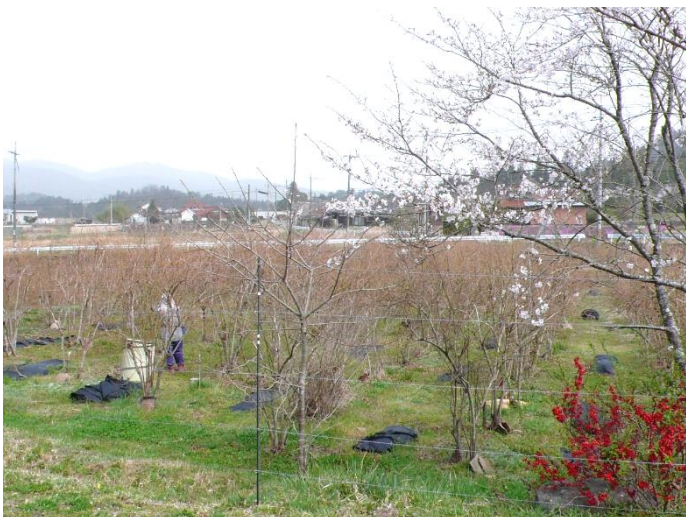
ブルーベリー畑のすぐそばのサクラは5分咲き。