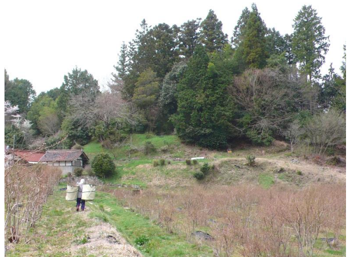
夕方安芸の郷で会議があるので早めに作業を切り上げる。