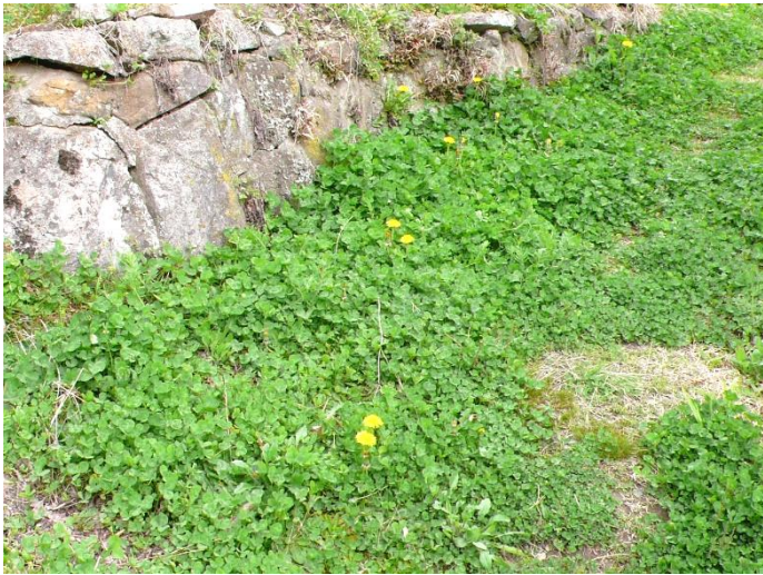
農道にはクローバがぎっしり。ちらほらタンポポが咲く。