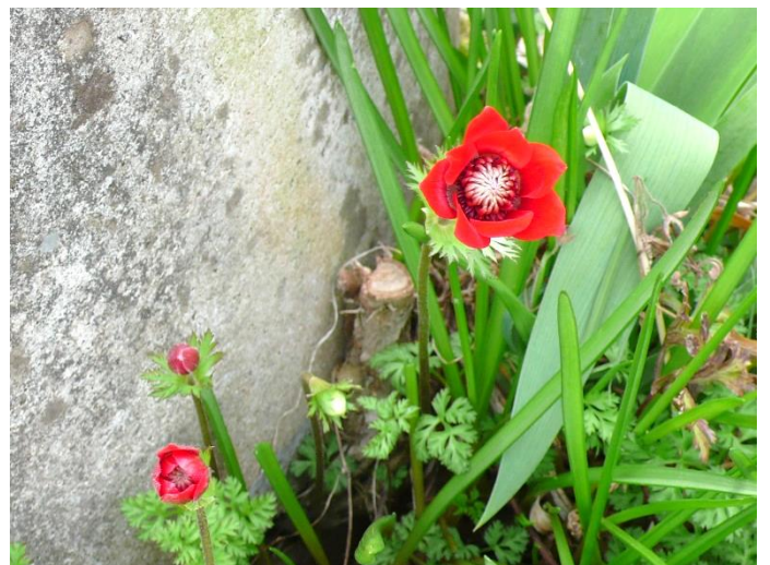
花壇のアネモネが開花。